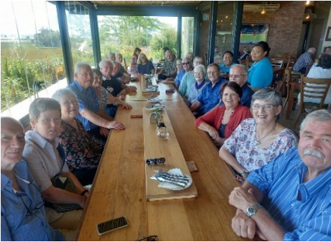
Ons wag vir ons koffie en koek by die lang tafel

Toe daar aan die begin van die jaar voorstelle gevra is vir uitstappies, kon ek nie anders as om voor te stel dat ons na Eseltjiesrus naby Mc Gregor gaan – die Eseltjies roep al lankal! Omdat ons nie op die warmste tyd van die jaar wil gaan nie, en ook nie reën wil hê nie, het ons gedink