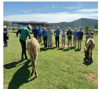
Ons kry 'n les by die donkies