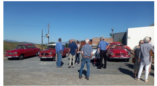
Ons uitstalling by Nuy on the Hill