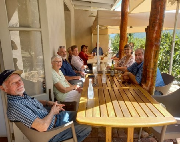
Op die stoep van Eseltjies se restaurant