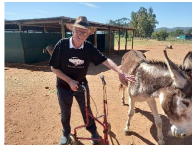
Evert dink sy donkievriend is 'n wonderlike ding

Nadat ons ongeveer 'n uur daar vertoef het, het ons koers gekry Mc Gregor toe via Robertson. Omtrent 5 km voor Mc Gregor is Eseltjiesrus, en ons het net na 12 uur daar ingedraai. Die Borgwards is by die donkiekampe geparkeer, en omdat die restaurant toe baie besig was, het ons almal eers 'n drankie gedrink en toe die baie interessante begeleide toer deur die donkiekampe gedoen. Dit was mooi om te sien en te hoor hoe goed die donkies versorg word, maar ook aandoenlik om te hoor in welke toestand hulle was a.g.v. wanvoeding en mis- Kramer is die beskermheer van Eseltjiesrus en hy het 'n baie mooi liedjie oor die donkies by Eseltjiesrus geskryf. Die liedjie se naam is Donkiehemel. Luister dit gerus op Google - dit is nogal hartroerend!