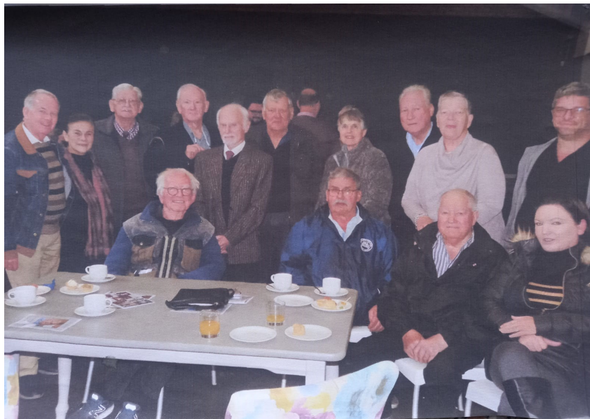
Klublede by Johan se troosdiens