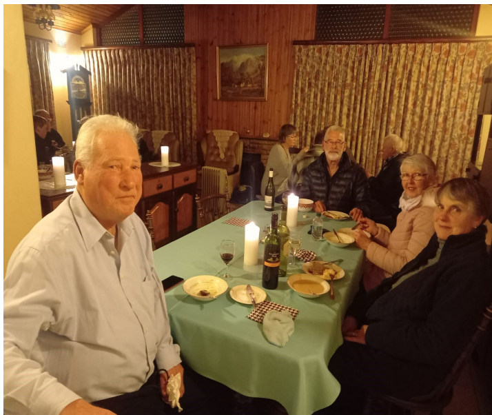
Ons smul aan die sop en brood