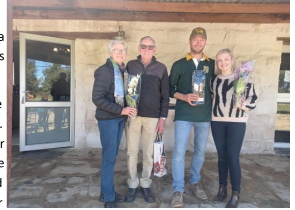
Ons gashere en gasvroue vir die dag

Eers ry hy 'n kort draai met ons deur Ceres se woongebied om vir ons te wys hoe pragtig die akkerbome bot. Die pragtige lowergroen bome was 'n lus vir die oog. Daarna vertrek ons plaas toe. Iewers langs die pad het ons gestop. Daar het hy vir ons vertel dat die berg daar die Waboomborg is. Dit is omdat daar so baie wabome groei. Wabome is ook 'n Protea spesie, maar hul blomme is nie so mooi nie en word nie ge-oes nie. Ook het hy vir ons uitgewys dat die boerdery gemeenskap daar bekend staan as die Warm Bokkeveld.