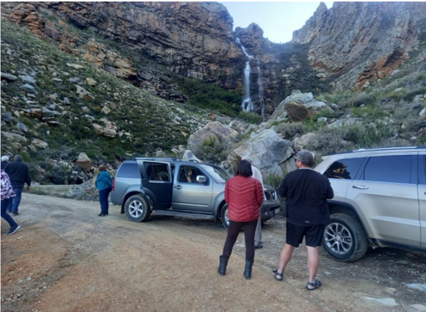
Die waterval – 'n week later het dit gelyk soos "Vic Falls"!