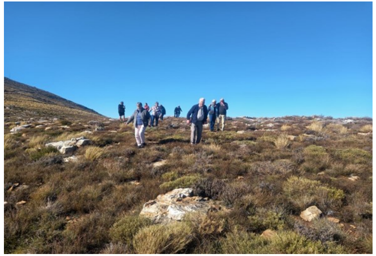
Bo op die berg—kyk waar jy trap!