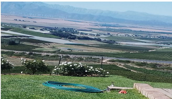
Uitsig vanaf Eight Feet oor die Riebeeck Vallei.