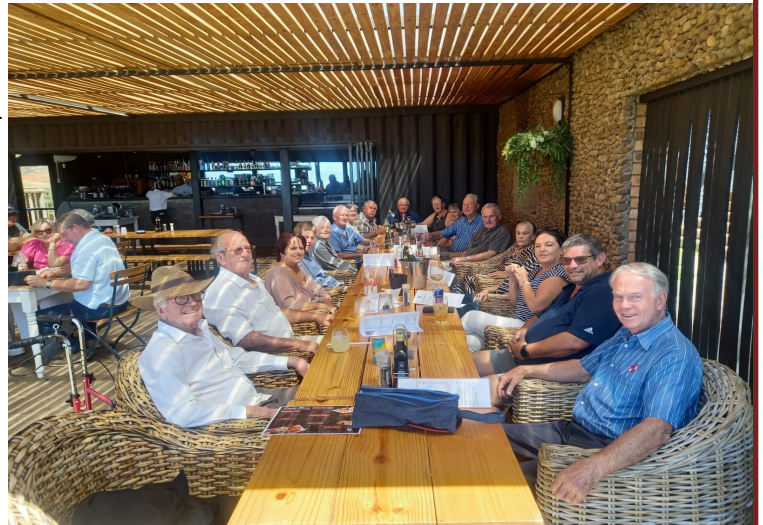
Ons kuier lekker terwyl ons wag vir die kos.